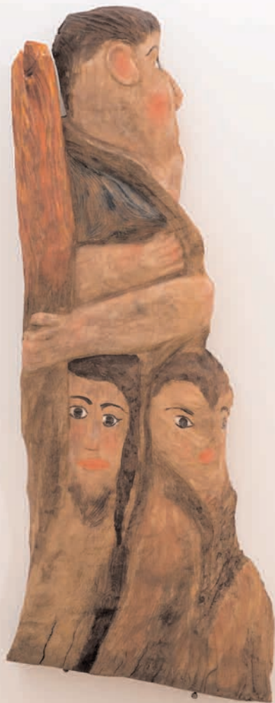
S/T 2006 madeira de castiñeiro policromada 45 x 112 x 12 cm