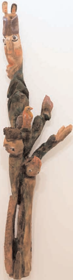
S/T 2006 madeira de mazaira policromada 36 x 132 x 24 cm