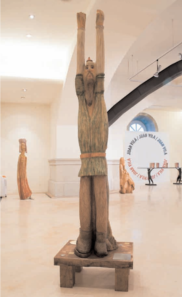
S/T 2006 madeira de castiñeiro 32 x 177 x 37 cm