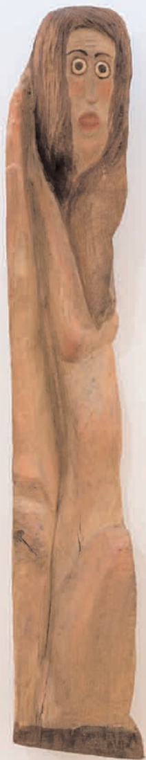
S/T 2007 madeira de castiheiro policromada 17 x 95 x 12 cm