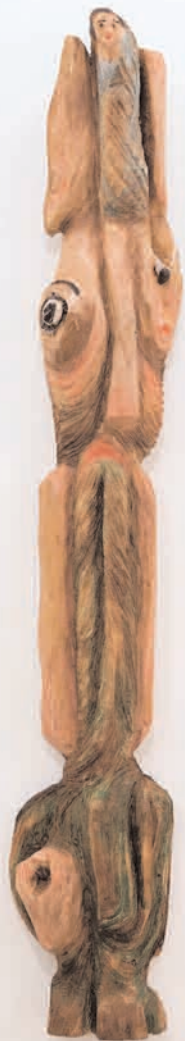
S/T 2007 madeira de castiñeiro policromada 18 x 110 x 12 cm