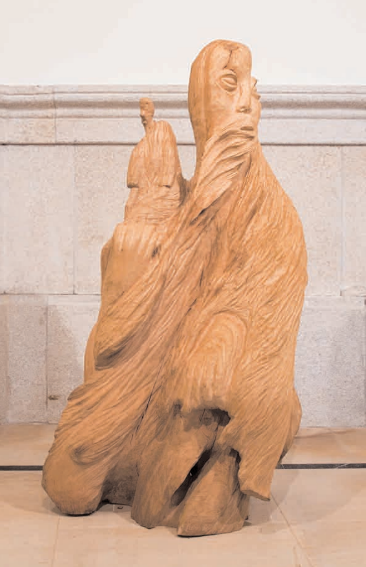
S/T 2007 talla directa en madeira de castiñeiro 111 x 54 x 48 cm