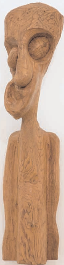
S/T 2006 madeira de castiheiro 16 x 73 x 15 cm