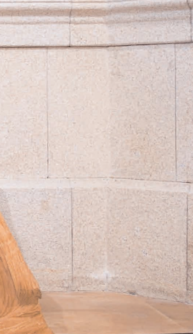
S/T 2007 madeira de castiheiro 61 x 102,5 x 36 cm